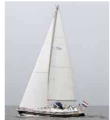
Smalle hoge zeilen met een relatief kleine voordriehoek. De tuigage is nog net fractioneel, voor enige mastbuiging.

Op de dekbeslagen is niet bezuinigd, maar de plaats van de genuaschootlieren vinden we onhandig, te ver naar buiten. De uitvoering van de tuigage is eenvoudig, maar doordacht. Het denkwerk is een samenspel tussen ontwerper, werf en De Vries Sails, sinds jaren en dag huiszeilmaker voor Zaadnoordijk. Enkele decennia geleden was een dergelijk groot schip voor twee personen meestal niet goed hanteerbaar. Vooral vanwege de grote voorzeilen. Op de C-Yacht 12.50 blijkt het gedeeltelijk doorgelatte grootzeil in combinatie met de high aspect-fok een prima