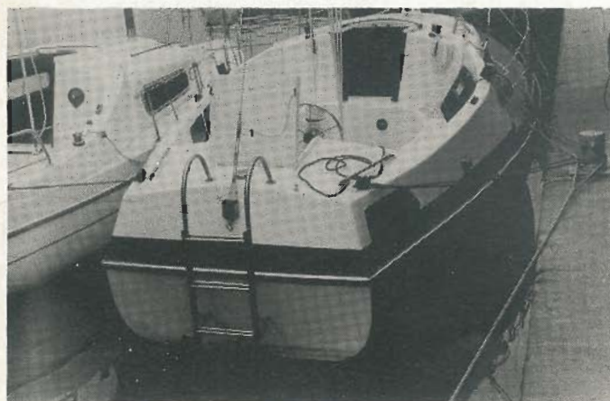
De Compromis 850 heeft een zeer ruime kuip en een goede zwemtrap.